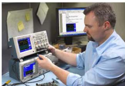
简便地存储及把波形和测量数据传送到USB。