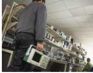
연구실 간 용이한 운반을 위한 경량 설계