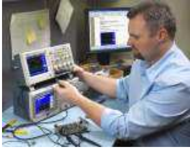
파형 및 측정 데이터를 USB에 쉽게 저장 및 전송