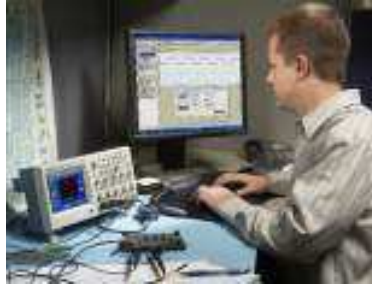
PC에서 정보의 문서화 및 분석