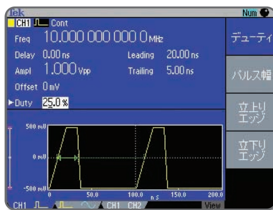
▶ 図2：パルス・パラメータ設定画面の例

ここで、任意波形/ファンクション・ジェネレータをパルス・ジェネレータとして使う場合の注意点を確認しておきます。まずはパルスの各パラメータの設定範囲が使用する用途に対応可能かどうかを確認します。これはパルス・ジェネレータ専用機を選ぶ際と同様です。次にパルス・ジェネレータとしての使い勝手を確認します。フロントパネルにパルス幅や立上がり/立下り時間を設定するためのボタンがあり、設定値を画面で簡単に確認できると安心です。